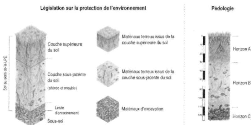
Figure 2 : Définitions du sol